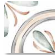
E235122 Rivette Chaud