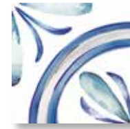
E235124 Rivette Gelé