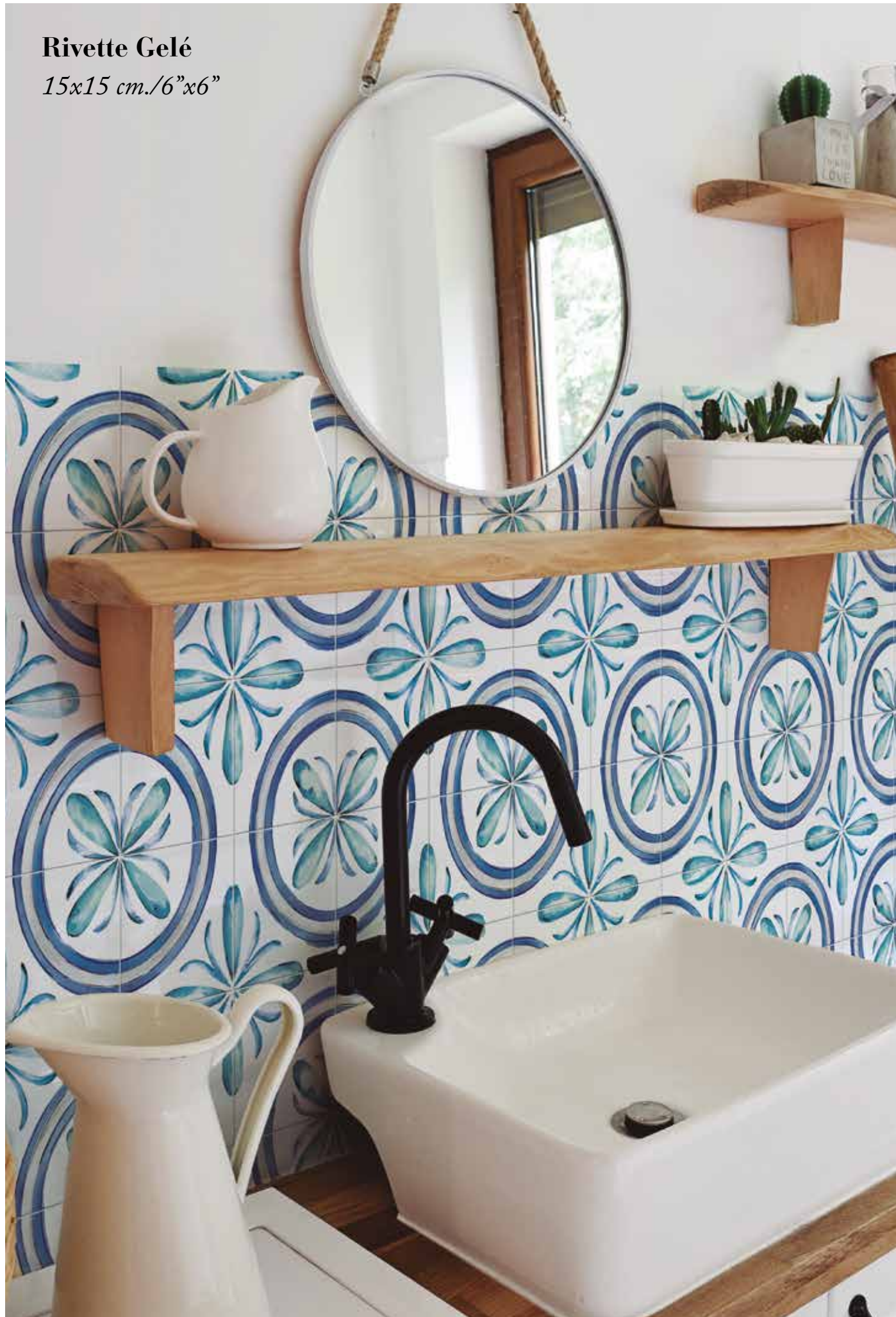
Rivette Gelé 15x15 cm./6"x6"